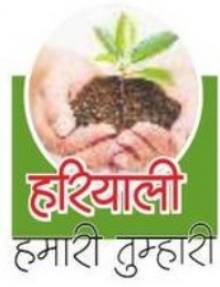
हरियाली हमारी तुम्हारी

ये कार्य होंगे ऊंची गिलयुक्त बाड़ड़ी, गेट, पॉथवे, झूले, फव्वारे, सोलर लाइट, आकर्षक मैनुअल लाइट, जनसुविधा केंद्र (प्रसाधन), बैंक, वॉटर कूलर, सबमर्सिबल, पौधे, हरियाली आदि।