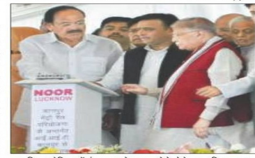
पश्चिम स्टडीयम में मंगलवार को कानपुर मेट्रो प्रोजेक्ट का शिलान्यास करने मुख्यमंत्री अखिलेश यादव, केंद्रीय शहरी विकास मंत्री वेंकैया नायडू व कानपुर नगर के सांसद डॉ. मुकुल मोहन जोशी।

अखिलेश-वेंकैया के रिमोट का बटन दबाते ही मेट्रो बार्ड का काम शुरू कानपुर। शहर में मंगलवार को मेट्रो प्रोजेक्ट का शुभारंभ हो गया। सीएम अखिलेश यादव और शहरी विकास एवं आवास मंत्री एम वेंकैया नायडू ने कानपुर मेट्रो बार्ड का लोकार्पण किया। रिमोट के जरिए कानपुर मेट्रो प्रोजेक्ट का शिलान्यास किया। इसके साथ ही पारंपरिक में मेट्रो के बार्ड और बाड़ड़ी बताने का काम शुरू हो गया। मेट्रो के बार्ड की सीमाएं देना, सुनिश्चित, आवास-विकास परिपट्ट, विक्रिया शिक्षा विभाग और निगम के 15.264 करोड़ की लागत वाले 196 विकास कार्यों का लोकार्पण-शिलान्यास भी किया। रिमोट ने 206 करोड़ रुपये की 88 योजनाओं का लोकार्पण और करीब 15 हजार करोड़ की 108 योजनाओं का शिलान्यास किया।