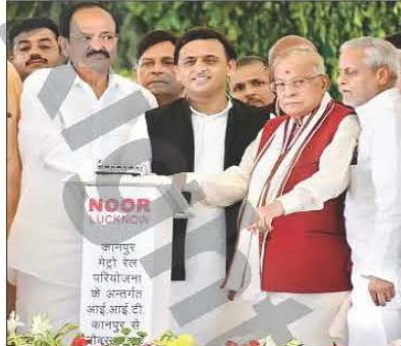
कानपुर मेट्रो रेल परियोजना के अंतर्गत आईआईटी कानपुर से शिलान्यास किया गया।

जमशेदपुर, झारखण्ड, कानपुर : पूरब के मैनचेस्टर को मेट्रो की सीमाएं देने की आधारशिला रख दी गई। मंगलवार को पश्चिम स्टडीयम में भवन समावेश में प्रदेश के मुख्यमंत्री अखिलेश यादव, केंद्रीय शहरी विकास, आवास एवं शहरी गरीबी निग्रहण मंत्री एम. वेंकैया नायडू और सांसद डा. मुकुल मोहन जोशी ने बटन दमकर 13,721 करोड़ रुपये की मेट्रो परियोजना का शिलान्यास किया। पश्चिम स्टडीयम में शिलान्यास के साथ ही पारंपरिक में मेट्रो बार्ड का काम शुरू हो गया। मुख्यमंत्री और केंद्रीय मंत्री ने इस अवसर पर कुल 15272.92 करोड़ रुपये की योजनाओं का लोकार्पण और शिलान्यास कर इन कामों के शिलान्यास का अनावधान किया।